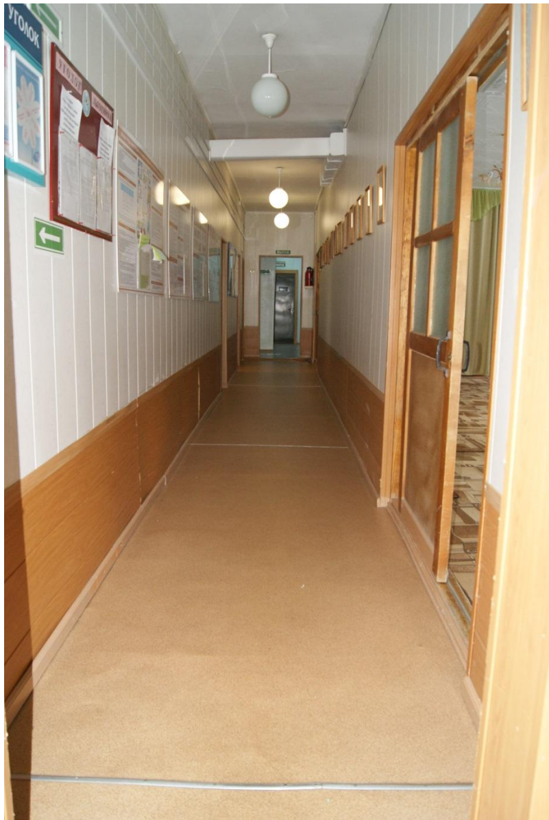
Фото 6. Коридор