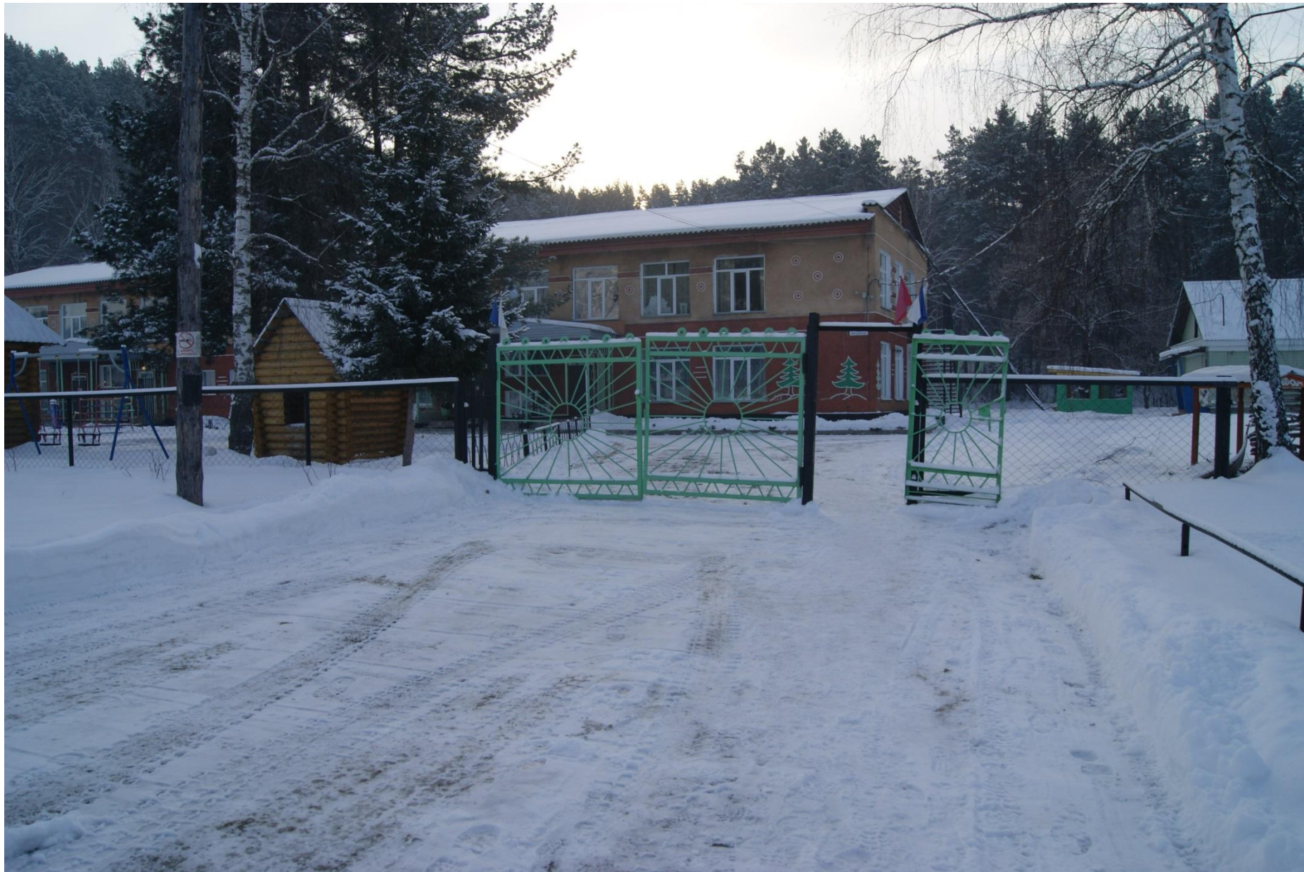
фото 1. Вход на территорию