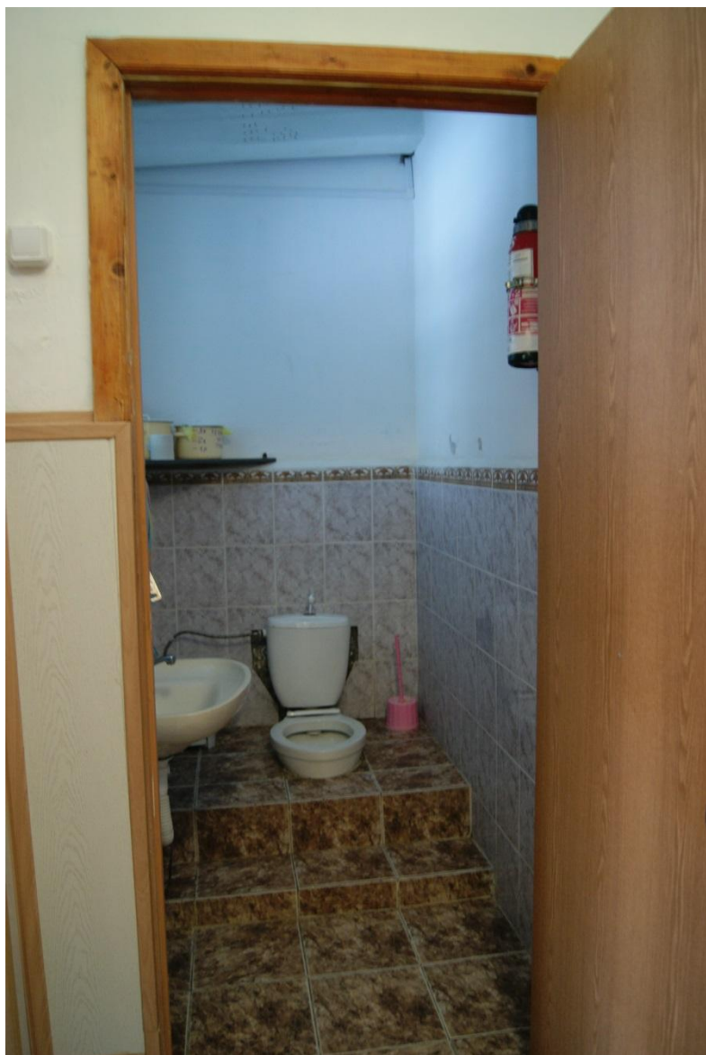
Фото 8. Туалет