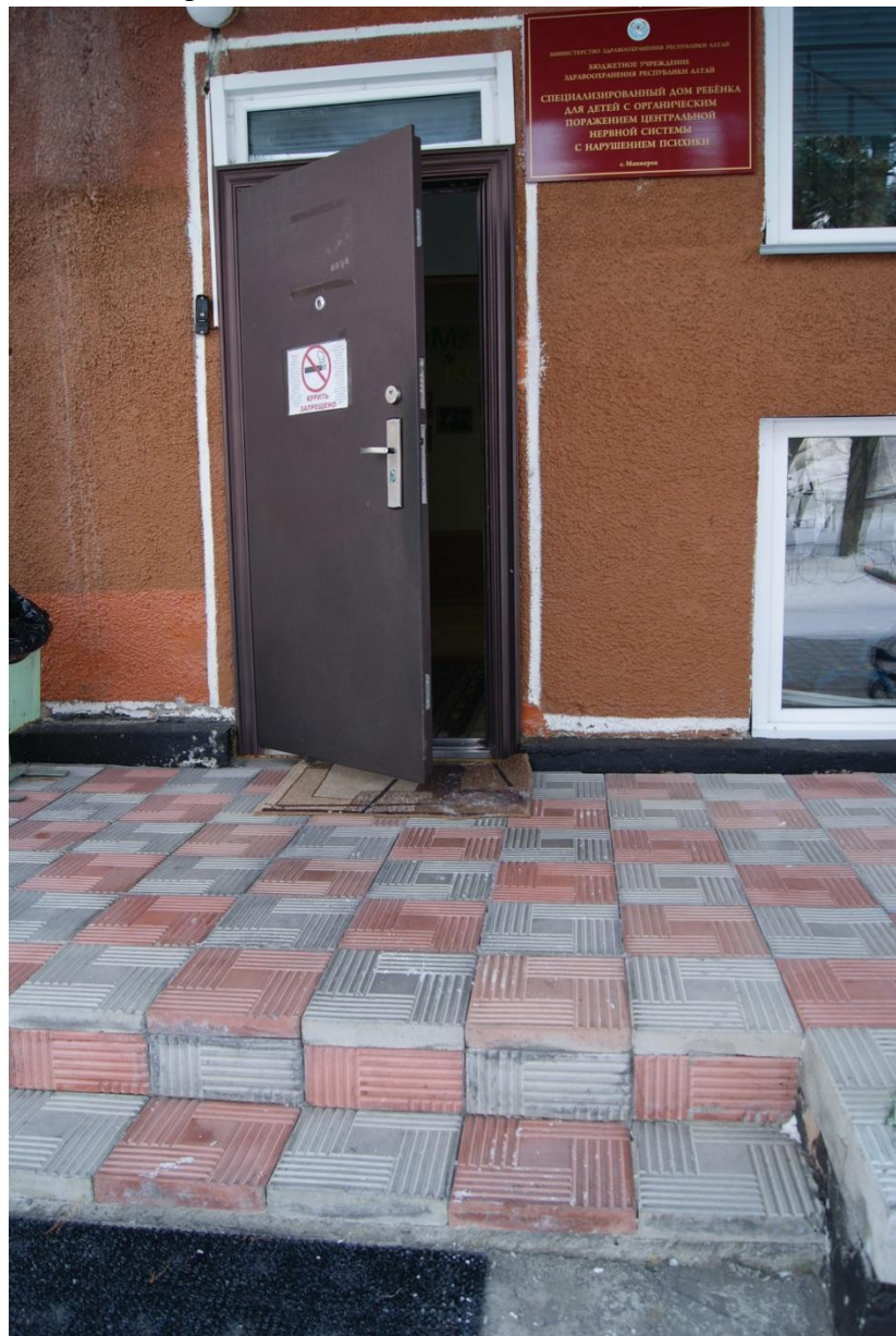
Фото 4. Дверь входная